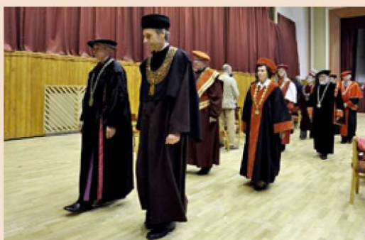
Rektori slovenských a zahraničných vysokých škôl