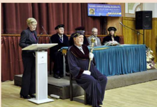
Príhovor primátorky Mesta Banská Štiavnica Nadeždy Babiakovéj