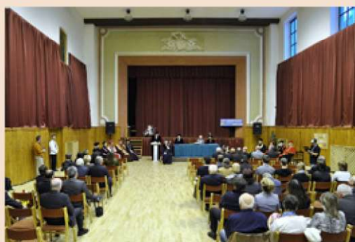
Slávnostné otvorenie akademického roka