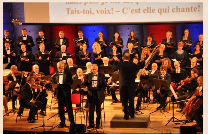
Pútnici, Paríž sála UNESCO