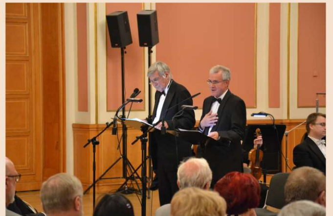
Pútnici, Berlín Rotes Rathaus