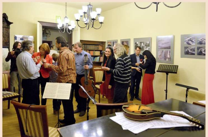
Koncert Skladatelia a interpreti v tvorivých prienikoch 22. 11. 2015