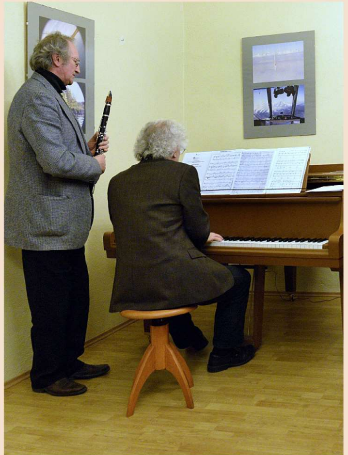
Vianočný koncert 19.12.2015