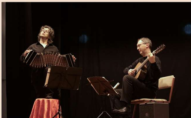
DUO ESCUALO Bandini, Chiacchiaretta