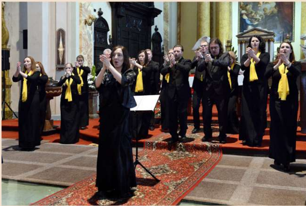
OMNIA, 7. 5. 2017