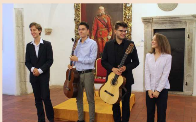
Koncert laureátov gitarových súťaží