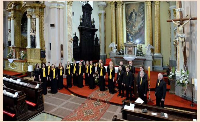
OMNIA, 7. 5. 2017